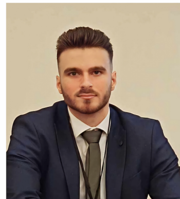
Αρθρογράφος: Συμεών Σταμπολίδης Μέλος Γραμματείας του ΣΕΑ

Η εταιρεία ανακοίνωσε ότι για τον μήνα Φλεβάρη 2024 είχε μειωμένες πωλήσεις κατά 3% λόγω εποχικότητας καθώς πέρυσι οι αποκριές ήταν 26/2 ενώ φέτος ήταν στις 17/3 με επακόλουθο οι πωλήσεις αποκριάτικων να γίνουν το Μάρτιο και ως αποτέλεσμα δεν φάνηκαν στις πωλήσεις του Φλεβάρη. Λογικό λοιπόν να αναμένουμε έναν καλύτερο Μάρτιο 2024 σε σχέση με τον Μάρτιο του 2023. Ακόμη η διοίκηση επανέλαβε την εκτίμηση της για αύξηση πωλήσεων 8% - 10% για το 2024.