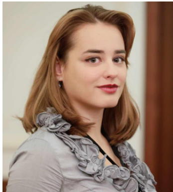
Αρθρογράφος: Ζωή Οικονόμου Μέλος Γραμματείας του ΣΕΔ

Το σκάνδαλο της Enron αποτελεί μία από τις μεγαλύτερες και πιο συγκλονιστικές περιπτώσεις εταιρικής απάτης στην παγκόσμια οικονομική ιστορία. Η Enron Corporation, μία από τις κορυφαίες εταιρείες ενέργειας στις Ηνωμένες Πολιτείες, κατέρρευσε το 2001 μέσα σε μια δίνη οικονομικών παρατυπιών, απάτης και κακοδιαχείρισης, αφήνοντας χιλιάδες υπαλλήλους και επενδυτές να αντιμετωπίσουν τεράστιες απώλειες. Η υπόθεση αποκάλυψε σοβαρά κενά στη ρύθμιση των εταιρικών πρακτικών και έφερε σημαντικές αλλαγές στην εταιρική διακυβέρνηση και τη νομοθεσία.